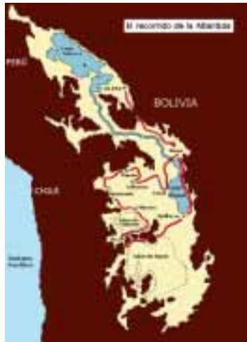
El recorrido de la Atlántida

No es una idea descabellada. Tal vez se trate de cambiar ideas.