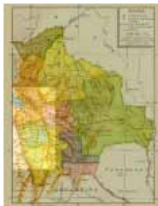
Ubicación en Bolivia

Escritores esotéricos posteriores, tales como Helena Blavatsky y Edgar Cayce , propusieron que la Atlántida era un lugar donde los espíritus se encarnaban en cuerpos humanos.