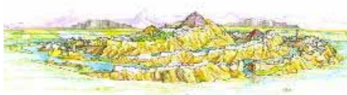
Dibujo ideal de la Atlántida descrita por Platón

El argumento de Allen ha recibido las críticas de varios académicos por considerarla demasiado general, mientras que otros académicos se inclinan a aceptarla por considerarla suficientemente coherente.