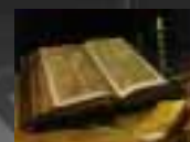
Laicismo en España página 12