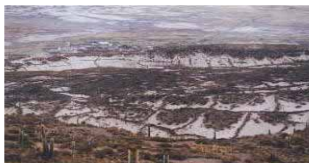
Panorámica arqueológica de remotos canales y asentamientos en el sitio donde dice Allen que estuvo la Atlántida.

Debido a la importancia de su contenido, lo publicamos en la Revista, cuya circulación es gratuita.