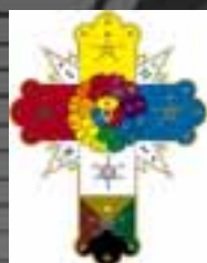
Manifiestos Rosacrucés página 8